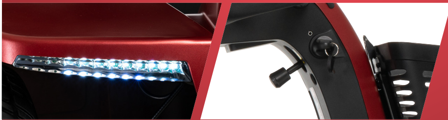
Ensemble complet d'éclairage DEL