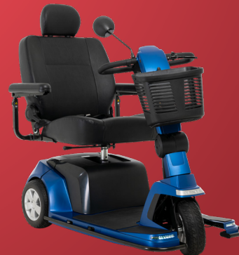
Levier d'ajustement de la colonne de direction à position infinie (verrouillage mécanique)